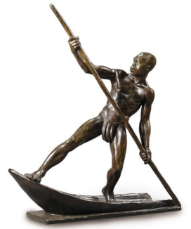
*Bambali est une ville située dans la région de Casamance

Bamba li bamba Soyé bamli bamba Bamba li bamba yé (bis) Yé wanatoli bayé Yé wanatoli bayé Wanatoli bayé Wanatoli bayé