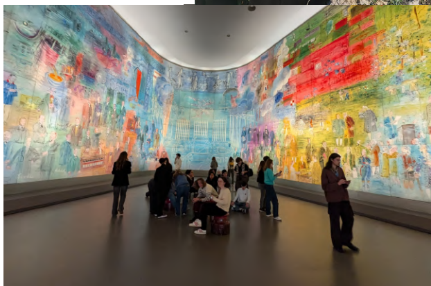
__Journées d'études à Paris, la Fée Électricité, de Raoul DUFY, TERMINALE spécialité.