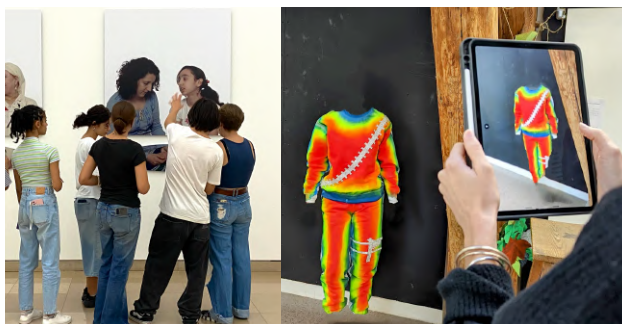
__Les élèves de seconde en visite à Carré d'art musée, à Nîmes.

La méthodologie dispensée vise les exigences de l'enseignement supérieur : orale, pratique et écrite. L'entraînement répété des situations vous permettra d'être à l'aise pour les deux épreuves de spécialité (écrite et orale) et le Grand Oral.