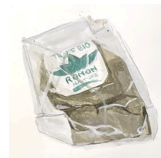
Recherches | observer, représenter

Un tremplin pour sa vie personnelle et professionnelle !