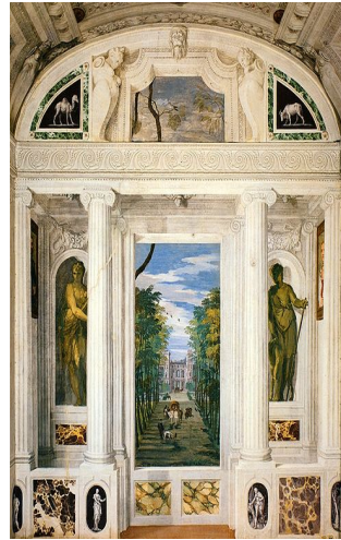
Fresques de la Villa Barbaro, 1560-1561, Véronèse, architecture d'Andrea Palladio, Maser, Italie.