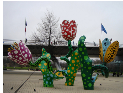
Yayoi Kusama, Les Tulipes de Shangri-La , 2004, béton armé, 7 mètres de haut, œuvre in situ, Lille.