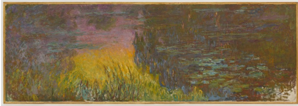
Claude Monet (1840-1926), Cycle des Nymphéas du musée de l'Orangerie, entre 1897 et 1926, huile sur toile, H. : 1,97 m, L. : environ 100 m linéaires, surface environ 200 m 2 . Paris, musée de l'Orangerie. Détail : Soleil couchant .

À partir de la sélection d'au moins deux œuvres du corpus que vous analyserez, développez une réflexion personnelle, étayée et argumentée, sur l'axe de travail suivant : le rapport entre réel et représentation.