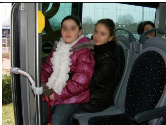
S'installer sur une même place.