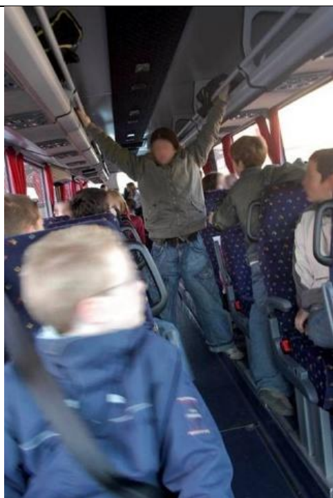
S'amuser et se déplacer dans le bus.