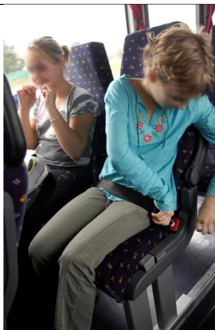
S'installer correctement en s'attachant.