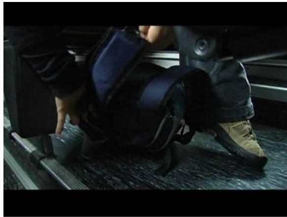
Cartable en sécurité sous le siège.