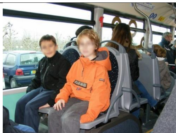
S'installer, chacun sur une place.