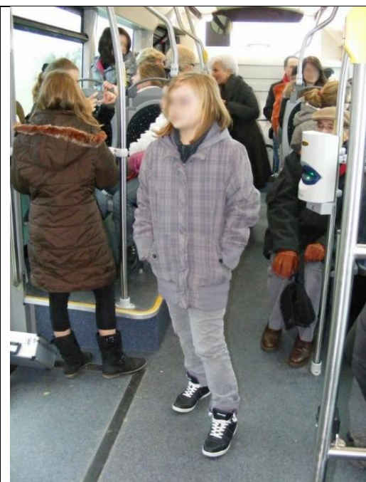
Se tenir debout dans un bus de ville sans précaution.