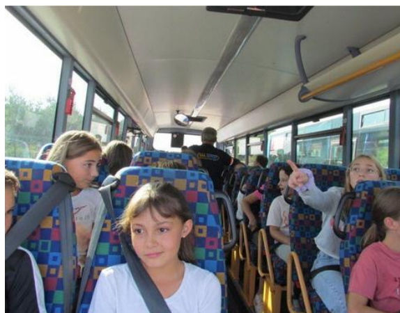
Se tenir correctement pendant le trajet.