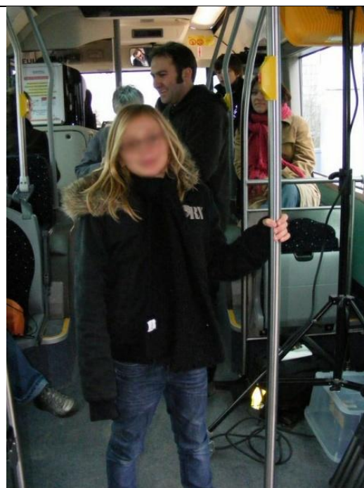
Se tenir debout dans un bus de ville en sécurité.