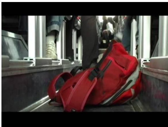
Cartable déposer dans l'allée.