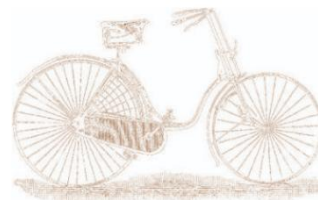
LA BICYCLETTE MODERNE