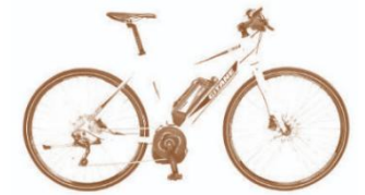
LE VÉLO À ASSISTANCE ÉLECTRIQUE