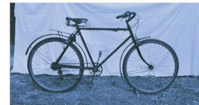
LA BICYCLETTE AVEC DÉRAILLEUR