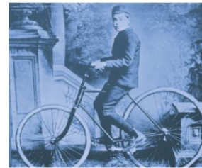
LA BICYCLETTE AVEC PNEUMATIQUE