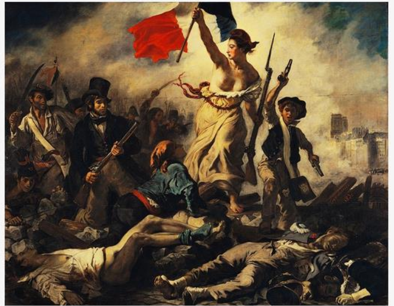
(Eugène Delacroix, "La Liberté guidant le peuple")

Composition basée sur le nombre d'or = composition harmonieuse