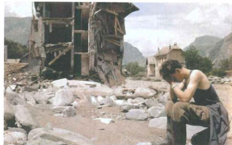
B. Une autre photographie