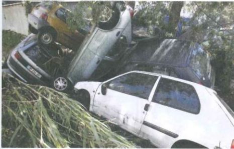
A. Une photographie