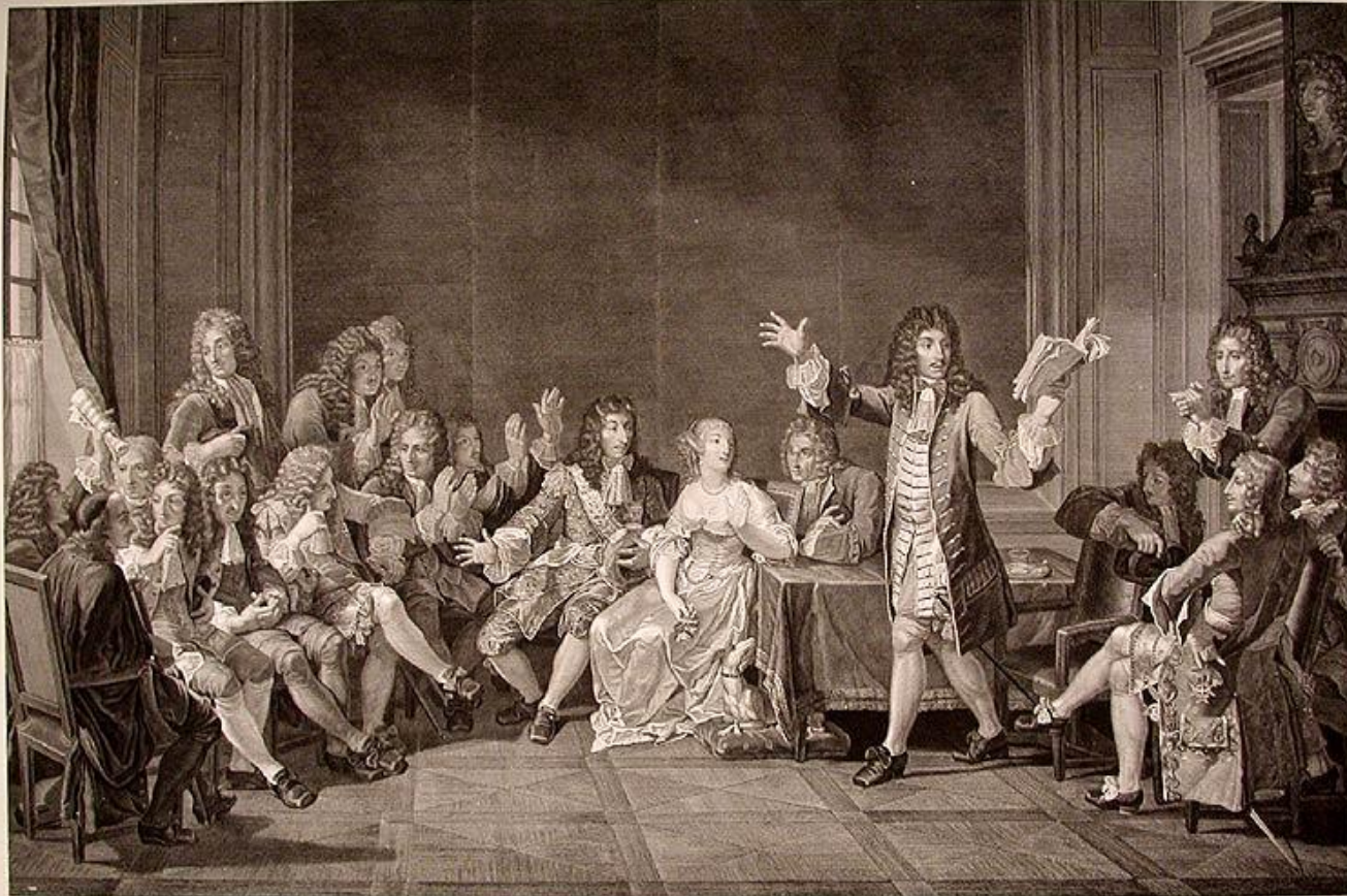
MOLIERE LISANT SON TARTUFE CHEZ MINON DE LENCLOS