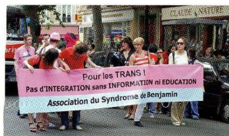
Manifestation de transsexuels à Paris

Les transsexuels sont des personnes qui estiment que leur identité sexuelle ne correspond pas à leur genre biologique. On parle de transsexuel masculin pour un homme qui se sent femme et de transsexuel féminin pour une femme qui