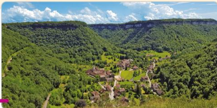
Baume-les-Messieurs, Jura (vue vers le sud).