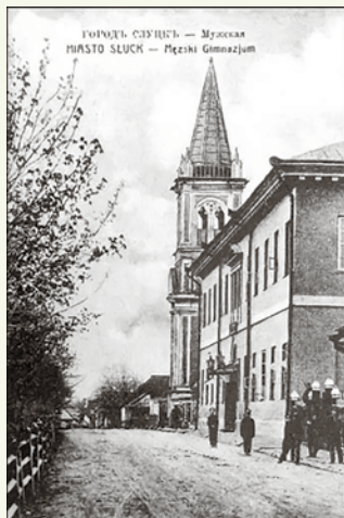
Слуцкая гимназия. Открытка. Начало XX в.