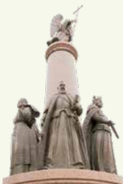
Памятник 1000-летию г. Бреста

Вскоре из католицизма в кальвинизм перешли крупные политические деятели страны Николай Радзивилл Рыжий, Ян Кишка, из православия — Остафий Волович, Юрий Зенович, Василий Тышкевич и др. При их поддержке во многих городах Беларуси были организованы кальвинистские общины с молитвенными домами, школами, больницами, типографиями. Распространение кальвинизма среди магнатов и шляхты стало настолько значительным, что в 1569 г. большинство панов-рады ВКЛ были сторонниками Реформации. Благодаря усилиям протестантской знати в 1573 г. был принят Акт Варшавской конфедерации, провозгласивший свободу вероисповедания для знати Речи Посполитой. Впоследствии этот документ был включен в Статут 1588 г.