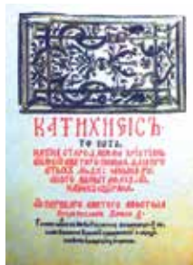
Катехизис С. Будного. Несвиж. 1562 г.

Через четыре года в Вильно состоялся первый съезд «евангелистов», был основан кальвинский сбор (церковь), организована Литовская кальвинистская губерния. Магнат начал внедрять новое учение на подконтрольных ему землях, передавая церкви и костелы кальвинистским проповедникам. Для пропаганды реформационных взглядов при его поддержке были основаны типографии в Несвиже и Бресте. В 1562 г. в Несвиже Сымон Будный издал «Катехизис» на старобелорусском языке.