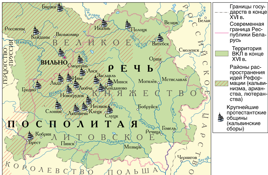
Реформационное движение в ВКЛ

Кем и когда был основан орден иезуитов? Каковы были его цели и методы деятельности?