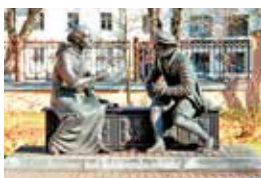
Симон Будный, Василий Тяпинский

Признавали социальные проблемы, но защищали государственный строй, считая, что изменения в обществе должны происходить постепенно