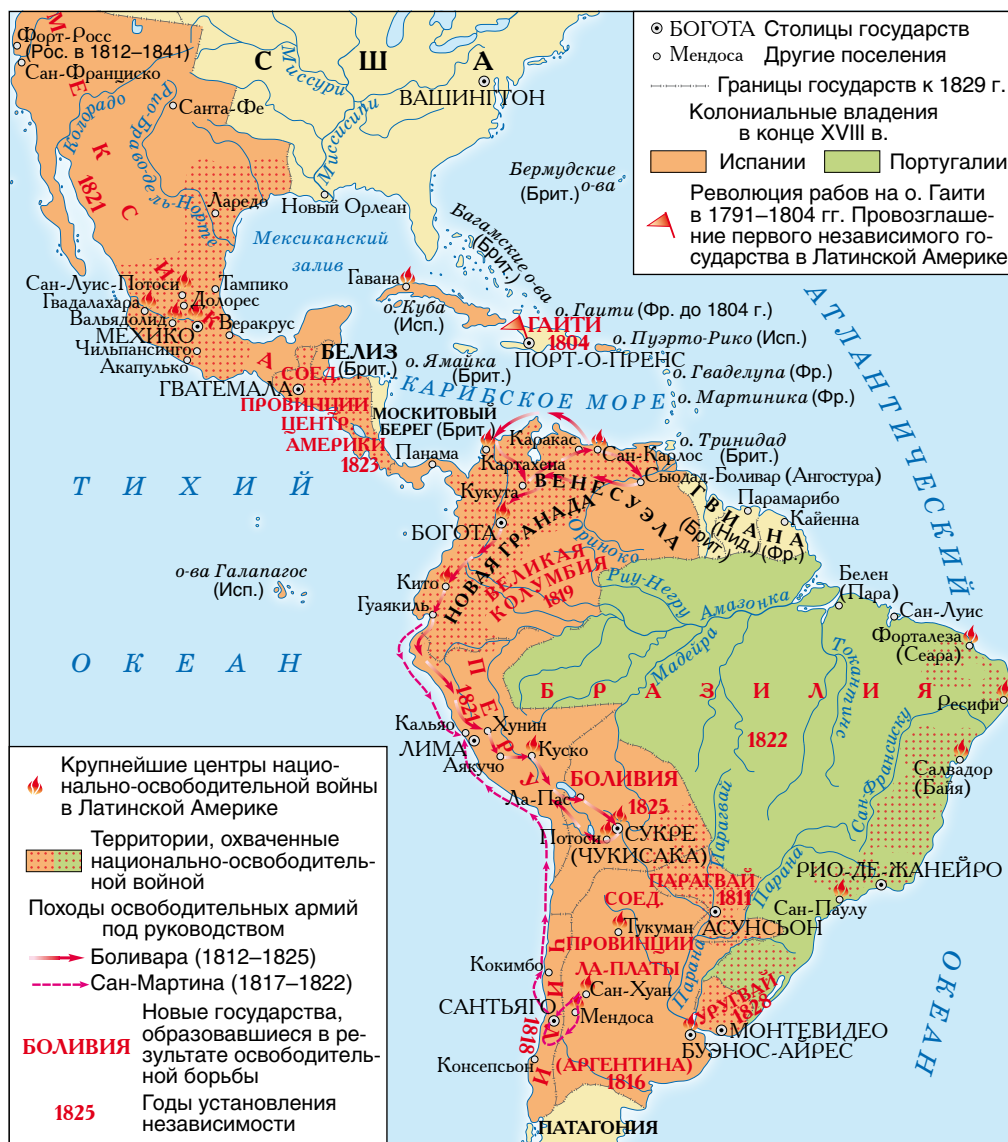
Латинская Америка в первой половине XIX в.

Какие новые государства возникли в Латинской Америке в результате Войны за независимость? Используя современную политическую карту мира, определите, какие из этих государств существуют в настоящее время.