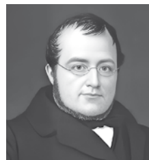
К. Б. Кавур