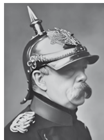
О. фон Бисмарк