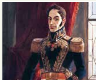
С. Боливар. Художник А. Микелена. 1895 г.

Путь к независимости Бразилии не сопровождался освободительной войной. В 1822 г. она отделилась от Португалии мирным путем. Принадлежавший к португальскому королевскому дому принц Педро был провозглашен императором. В Бразилии до 1889 г. существовала монархическая форма правления.