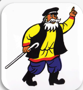
Le grand père