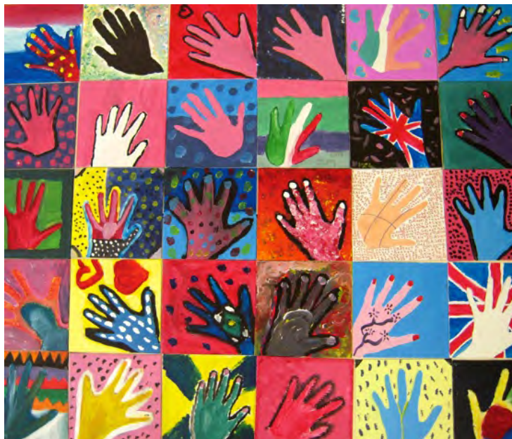
Projet « Expression », collège Albert Camus (Genlis), année 2012/2013

L'action éducative est une démarche collective ou individuelle qui permet aux élèves d'acquérir les compétences sociales et civiques du socle commun de connaissances, de compétences et de culture. Elle se matérialise à travers la mise en œuvre des projets éducatifs transversaux dans le cadre du projet d'école ou d'établissement, des projets éducatifs territoriaux, de l'accompagnement éducatif, du parcours d'éducation artistique et culturelle (circulaire N°2013-073 du 3 mai 2013).