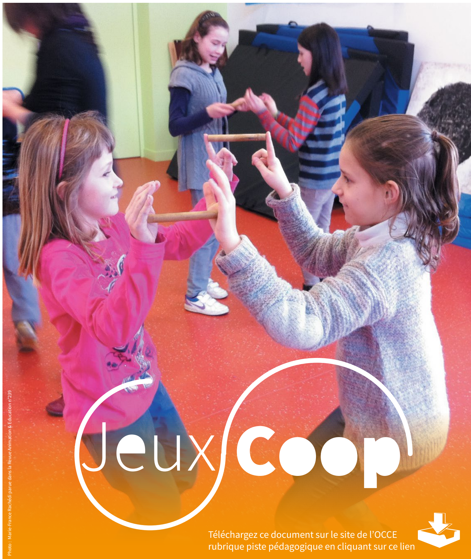
Photo : Marie-France Raché | parue dans la Revue Animation & Éducation n°239