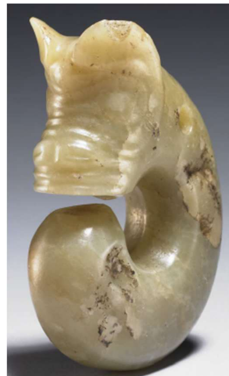
Cochon-dragons Nord-est de la Chine Fin de la culture de Hongshan (4700-2900 avant notre ère) Jade, Taipei Inv. 012547 012547

Cette exposition s'inscrit dans le cadre d'une coopération et d'échanges entre le National Palace Museum de Taipei et le musée du quai Branly- Jacques Chirac, et permettra la présentation exceptionnelle et inédite d'une centaine de pièces du National Palace Museum, dont plusieurs trésors nationaux.