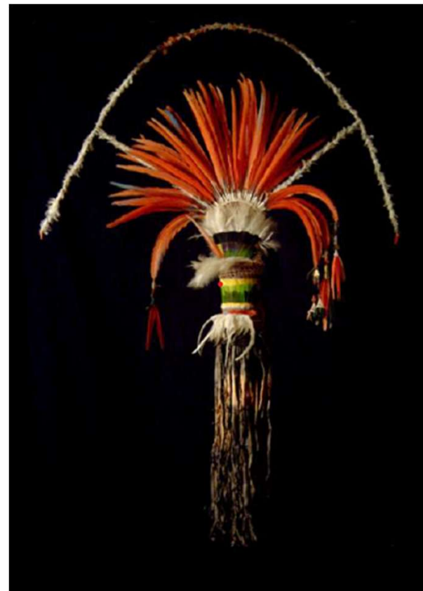
Masque olok, Brésil, 1930-1945, Fibres végétales, coton, élytres, plumes Inv. 70.2004.6.1.1-2

Célèbre, l'Amazonie est connue de toutes et tous. Pourtant, au-delà de sa végétation exubérante, cette région du monde reste entourée d'un certain flou. Loin d'une vision stéréotypée encore véhiculée aujourd'hui, l'Amazonie est présentée comme un ensemble culturel, formé par une multiplicité de peuples dont la diversité culturelle et biologique est étroitement liée : création du monde selon les cosmologies amazoniennes, diversité et fluidité des genres, liens entre les humains et différentes formes d'altérité (animaux, végétaux, esprits et occidentaux), savoirs traditionnels et scientifiques, réseaux tissés entre villages et zones urbaines.