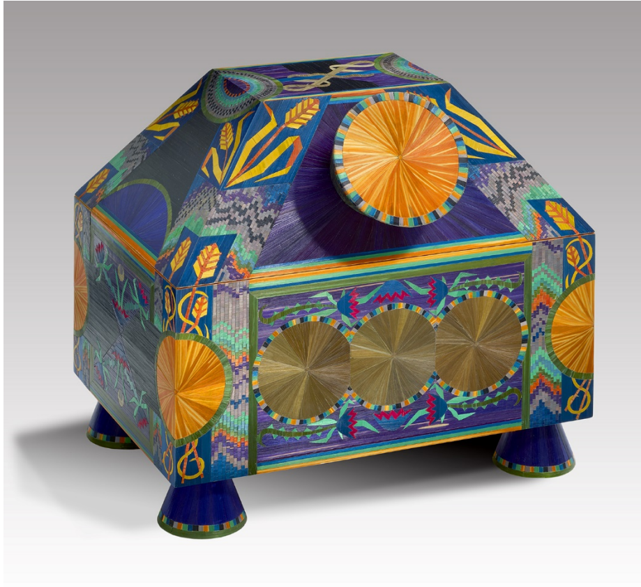
MARIE Pierre , artiste décorateur, La Boîte à Soleil , marqueterie de paille, dessiné par Pierre Marie et réalisé par l'atelier Lison de Caunes, pièce unique, 260 x 260 x 180 mm, France, 2022.