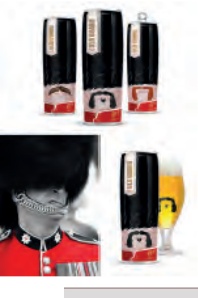
Packaging pour la bière Old Guard

Selon le groupe de produits de snacking Mondelez (Lu, Milka, Oreo...): "Avec un packaging, il faut arriver à se démarquer dans un univers très codifié". Que veut dire cette phrase pour vous? Justifiez votre réponse. (environ 5 lignes)