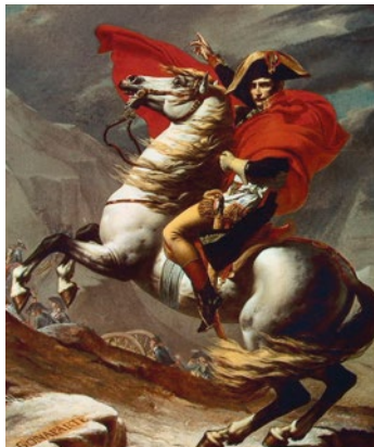
Bonaparte franchissant le Grand-Saint-Bernard par Jacques-Louis David. Musée national du Château de Malmaison

La décentralisation amène des transferts de compétences de l'État vers les Collectivités Territoriales (Commune, Département, Région) depuis la loi du 2 mars 1982.