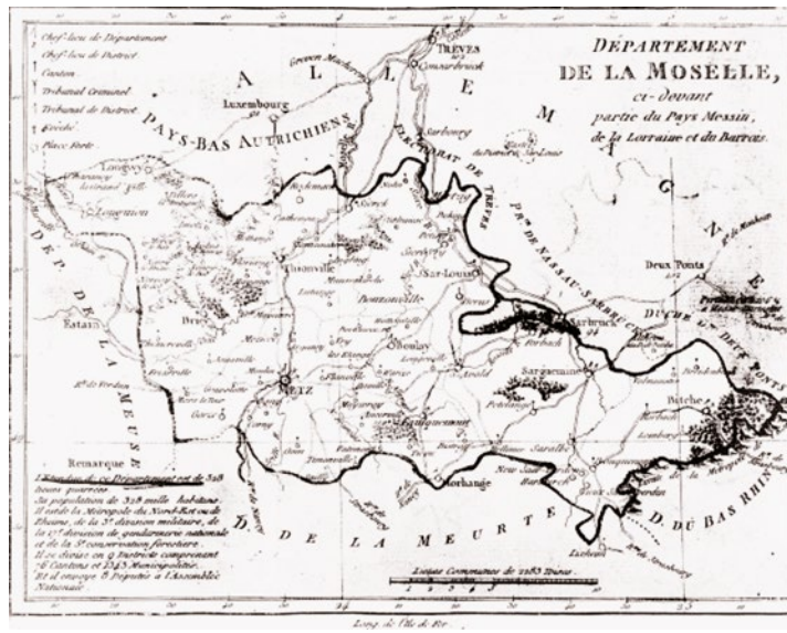
Carte de l'ancien Département français de la Moselle