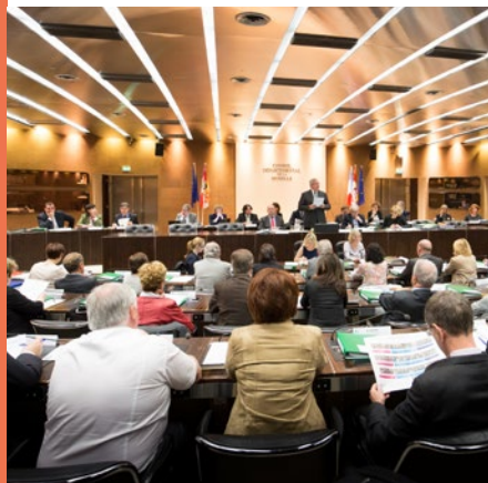
L'Assemblée Départementale dans la Salle

Les membres de la Commission Permanente sont élus par les Conseillers Départementaux