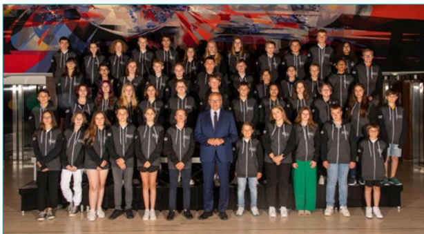
Conseil Départemental des Jeunes 2022 - 2025