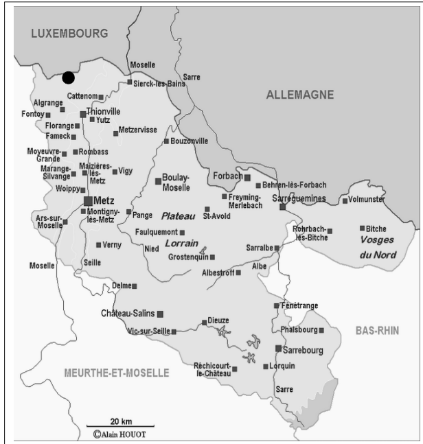
Carte 1 : Le département de la Moselle