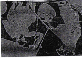
D. Les citoyens

Détail d'une coupe, V e siècle avant J.-C., Ashmolean museum, Oxford.