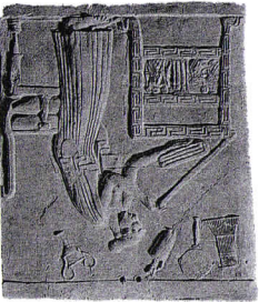
A. Les femmes

Les femmes et les enfants de citoyens sont environ 90 000, soit 35 % de la population d'Athènes.