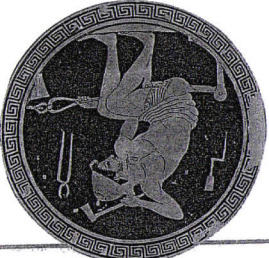
C. Les métèques

Détail d'un vase, V e siècle avant J.-C., Ashmolean museum, Oxford.