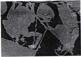
D. Les citoyens

Détail d'une coupe, V e siècle avant J.-C., Ashmolean museum, Oxford.