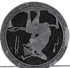
C. Les métèques

Détail d'un vase, V e siècle avant J.-C., Ashmolean museum, Oxford.