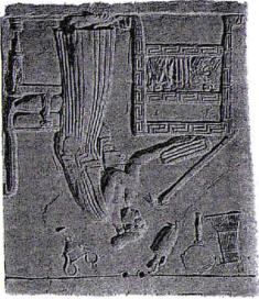
A. Les femmes

Les femmes et les enfants de citoyens sont environ 90 000, soit 35 % de la population d'Athènes.