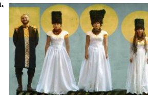
Chanteurs du groupe Dakhbrakha

Mexique – Russie – Ukraine – Roumanie – Suisse