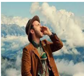
Berger faisant du Yodel

Mexique – Russie – Ukraine – Roumanie – Suisse