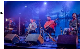
Huun Huur Tu en concert

Mexique – Russie – Ukraine – Roumanie – Suisse