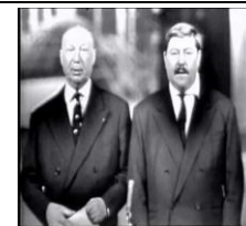
Pierre Dac et Francis Blanche

VRAI / FAUX VRAI / FAUX VRAI / FAUX VRAI / FAUX VRAI / FAUX