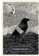
Affiche inspirée des paroles