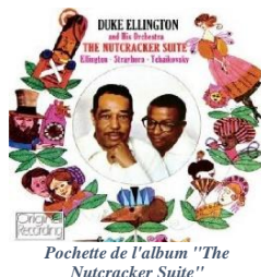
Pochette de l'album "The Nutcracker Suite"

VRAI / FAUX VRAI / FAUX VRAI / FAUX VRAI / FAUX VRAI / FAUX