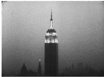
Andy Warhol, Empire , 1964, film 16 mm, 8h05, archives Warhol

Un petit port sur la côte ouest de l'Écosse