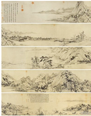
Huang Gongwang, Séjour dans les Monts Fuchun , 1348-1350, rouleau encre sur papier (~50 × 600 cm), Zhejiang Museum / NPM Taipei