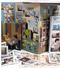
Chris Ware, Building Stories , 2012, coffret narratif BD + plans + livrets, Pantheon Books