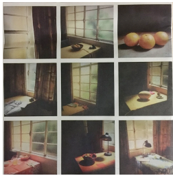
Daniel Blaufuks, Attempting Exhaustion , 2017, livre photo, Pierre von Kleist Editions