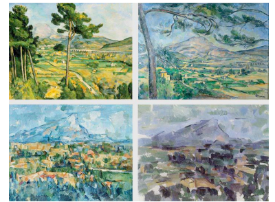
Paul Cézanne, Série Montagne Sainte-Victoire , 1880-1906, huiles sur toile, diverses collections