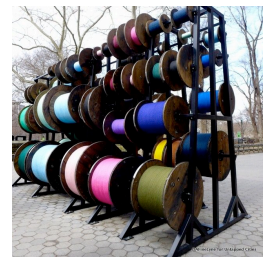
Tatiana Trouvé, Desire Lines , 2015, installation, Central Park (NY)