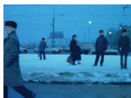
Chantal Akerman, D'Est , 1993, film documentaire, 1h47, Cinémathèque royale de Belgique