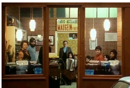
Agnès Varda, Daguerréotypes , 1975, film documentaire, 75 min, Ciné-Tamaris