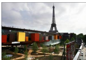
Le Musée du Quai Branly