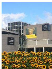
Le musée Van Gogh