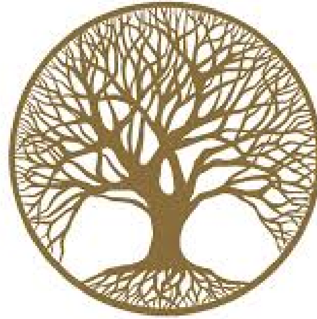
arbre de vie