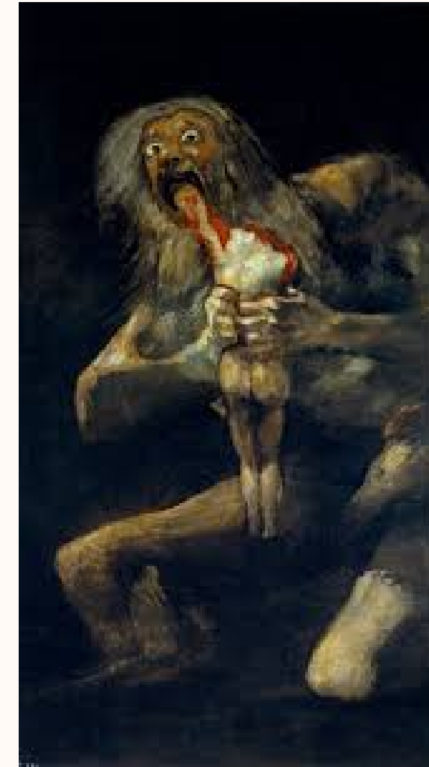
Saturne dévorant un de ses fils