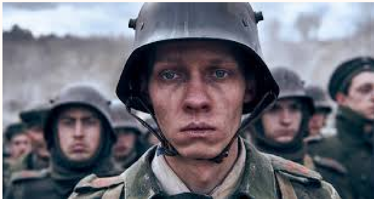
All quiet in the western front, 2022