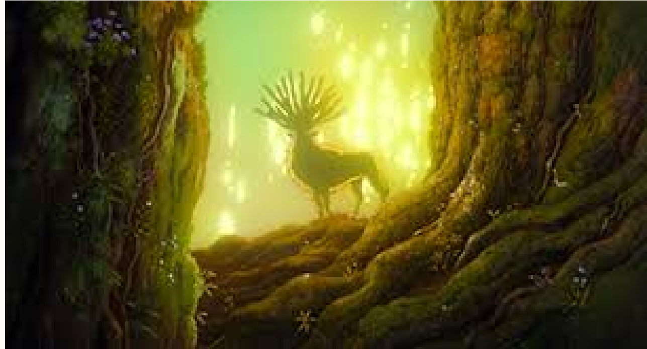
Pincesse Mononoké, 1997