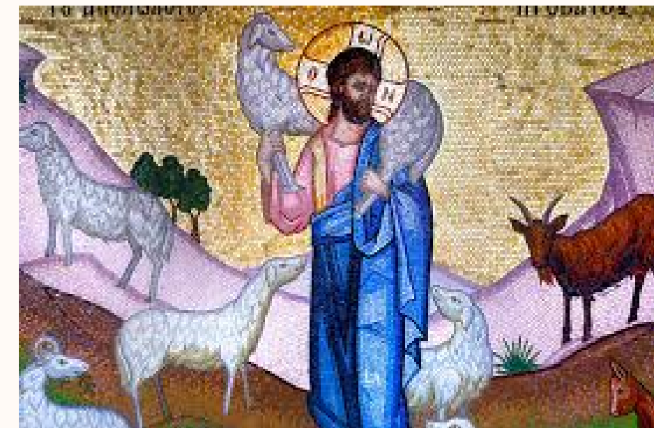
Icons de Jesus avec des brebis