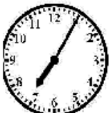
It is seven oh five.