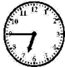
It's quarter to seven