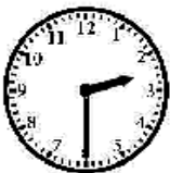
It is two thirty.