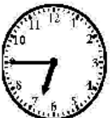
It is six forty-five.

Attention : on utilise le système des 12h en anglais :