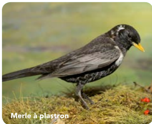
Merle à plastron