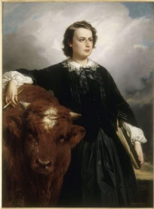
Portrait du peintre Rosa Bonheur aux côtés d'un bovidé, Edouard Dubufe (1819 - 1883)