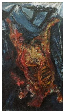
Le bœuf écorché, Soutine, 1925