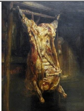
Le bœuf écorché, Rembrandt, 1655