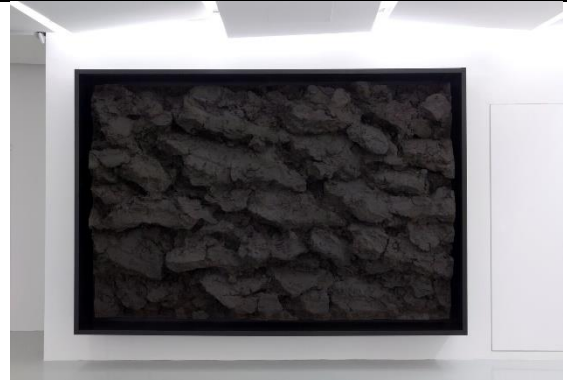
Didier Marcel : moulage terre labourée Haut relief (accrochage vertical). Le travail de Didier Marcel interroge notre relation au paysage, notre manière de le transformer, de le modeler ou de l'admirer.