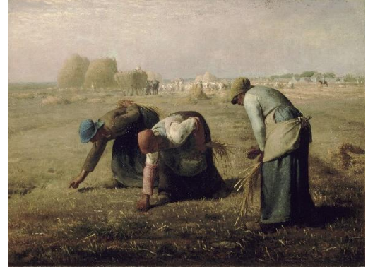
Des glaneuses 1857

A la même époque, Jean-François Millet rendait compte de manière moins grandiloquente de la vie paysanne, lui qui avait une connaissance intime de celle de son temps