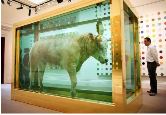
Damien Hirst , l'animal immobile, figé, mort. En opposition au mouvement à la force vitale des bœufs.