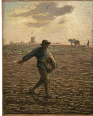
Le Semeur , 1850