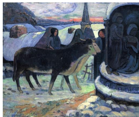
Nuit de Noël ou La bénédiction des bœufs, Gauguin,