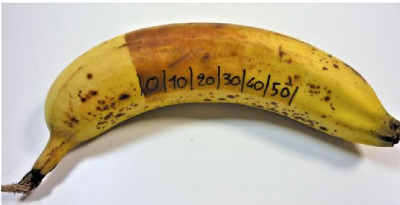
Figure 1 - Banane dont la partie centrale a été exposée aux UV, puis exposée 0, 10, 20, 30, 40 et 50 min à la lumière du Soleil