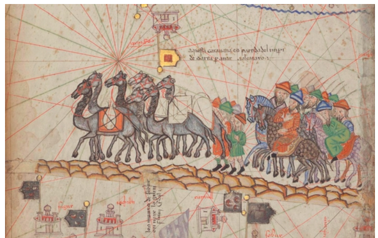
Détail de l'Atlas Catalan, 1375