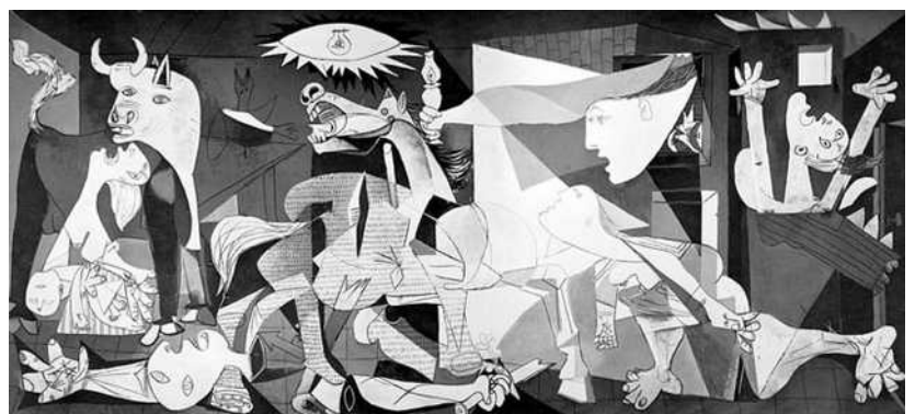
Pablo PICASSO, Guernica , 1937 huile sur toile gigantesque (3,49 m x 7,77 m)