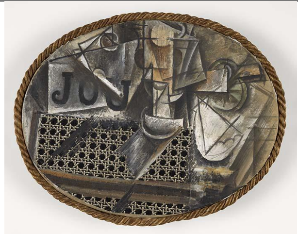
Nature morte à la chaise cannée , 1912, huile sur toile, toile cirée et corde, 29 x 37 cm. Musée Picasso, Paris