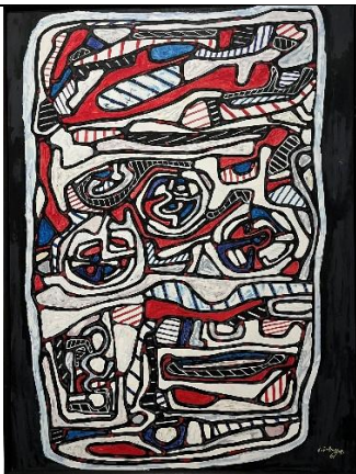
Cuisinière à gaz II , 1966, vinyle sur toile, 130 x 97 cm. Collection Fondation Dubuffet