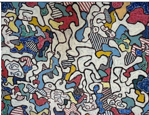
Mouchon berloque , 1963, huile sur toile, 114 x 146 cm. Collection Fondation Dubuffet