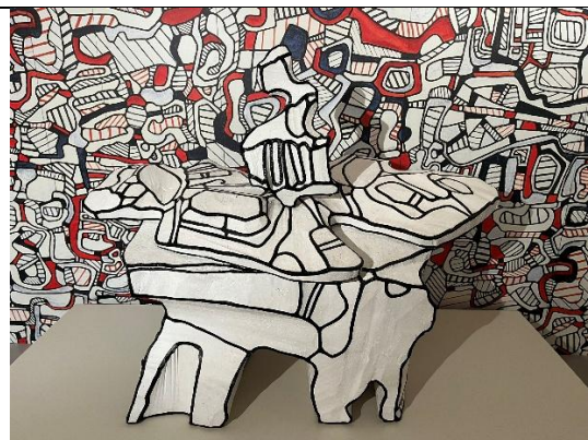
Table porteuse d'une carafe , 1968-69, résine époxy peinte au polyuréthane, 111 x 148 x 115 cm. Collection Fondation Dubuffet