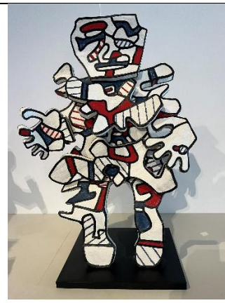
Papa la cravate , 1973, résine époxy peinte au polyuréthane, 245 x 172 x 92 cm. Collection Fondation Dubuffet