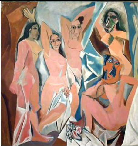
Les Demoiselles d'Avignon , 1906-1907, h/t, 243,9 x 233,7 cm. MOMA, New York