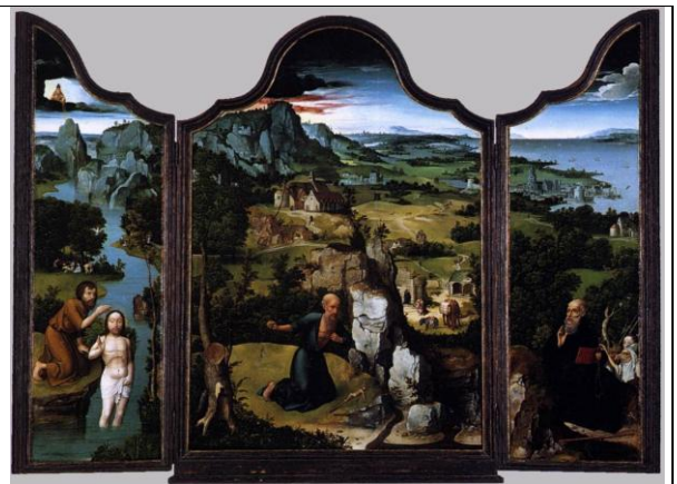
J. PATINIR, Triptyque de Saint Jérôme , vers 1520, h/b, 118 x 81 cm et 121 x 36 cm x2. Metropolitan Museum, New York.