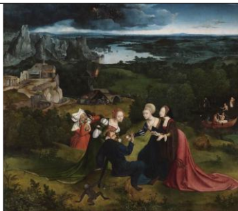
J. PATINIR, Quentin METSYS, La tentation de Saint Antoine , vers 1515, h/b, 155 x 173 cm. Musée du Prado, Madrid.