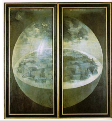
Jérôme BOSCH, Le jardin des délices , 1490-1500, h/b, triptyque, 220 x 386 cm. Musée du Prado, Madrid.