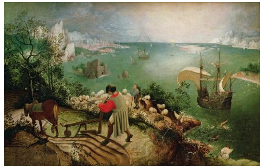
Pierre BRUEGHEL L'Ancien, La chute d'Icare , 1558, h/t, 73 x 112 cm. Musées Royaux des Beaux-Arts de Belgique, Bruxelles.