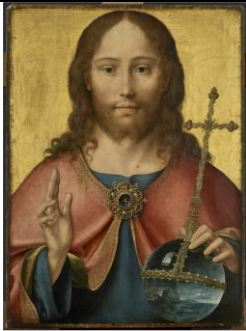
Joos VAN CLEVE, Salvator Mundi , 1516-1518, h/b, 54 x 40 cm. Musée du Louvre, Paris.