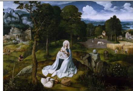
J. PATINIR, Le repos pendant la fuite en Égypte , 1518-1520, h/b, 121 x 177 cm. Musée du Prado, Madrid.