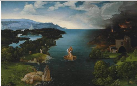
J. PATINIR, La traversée du Styx , 1515-24, h/b, 64 x 103 cm. Musée du Prado, Madrid.