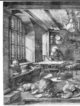
Albrecht DÜRER, Saint Jérôme dans sa cellule , 1514, gravure, burin, 24,7 x 18,8 cm. Kuperslich-Kabinett, Dresde.