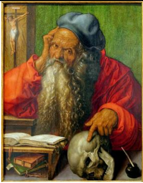
Albrecht DÜRER, Saint Jérôme , 1521, h/b, 60 x 48 cm. Musée National d'Art ancien, Lisbonne.