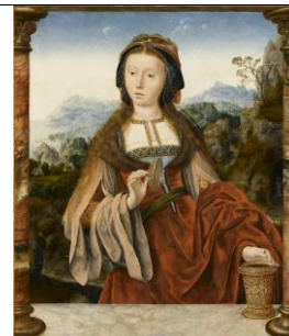
Quentin METSYS, Sainte Madeleine , 1500-1535, h/b, 85 x 73 cm. Musée du Louvre, Paris.