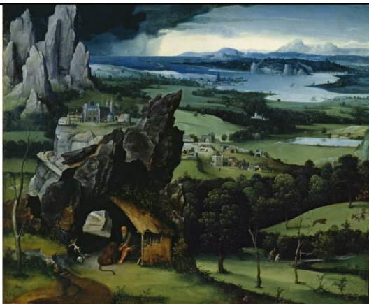
J. PATINIR, Paysage avec Saint Jérôme , 1515-1519, h/b, 74 x 91 cm. Musée du Prado, Madrid

Autres œuvres de Patinir sur le même sujet :