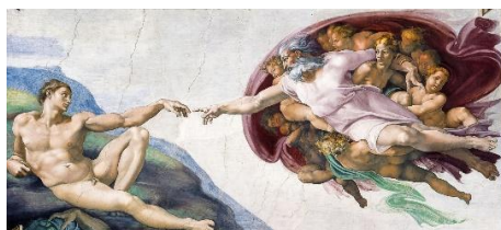
MICHEL ANGE, Plafond de la Chapelle Sixtine , 1508-1512, fresque, 40,93 x 13,41 m. Rome.