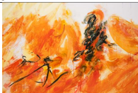
Megan ROONEY, With Sun (détail), 2022, peinture d'intérieur, acrylique, peinture à la bombe, bâton à l'huile, pastel, crayon