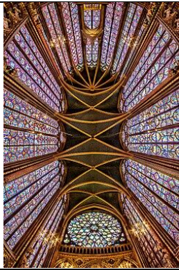
Art gothique, vitraux de la Sainte chapelle, 1242-1248, Paris.