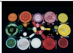
Sophie CALLE, extrait de Le régime chromatique , 1997, 7 photographies couleurs encadrées, chaque photo 49 x 73,5 cm, Galerie Perrotin, Paris