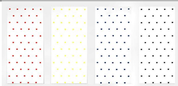
Niele TORONI, Empreintes de pinceau n°50 répétées à intervalles réguliers de 30 cm , 1997, acrylique sur toile • 300 × 140,5 cm chacune