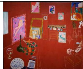
Henri MATISSE, L'Atelier rouge , 1911, peinture à l'huile sur toile, 162 x 219 cm, Museum of Modern Art, New York