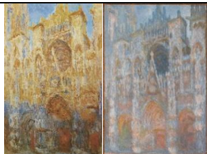
Claude MONET, La cathédrale de Rouen, effet de soleil, fin de journée , 1892, peinture à l'huile sur toile, 100 x 65 cm, musée Marmottan