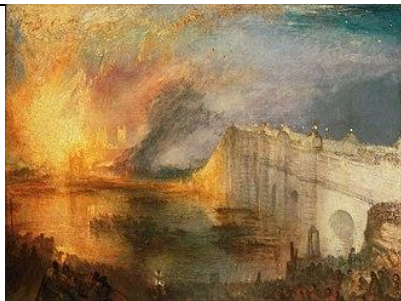
William TURNER, L'incendie de la Chambre des lords et des communes , 1835, huile sur toile, 92 x 123 cm. Philadelphia Museum of Art, Philadelphie.