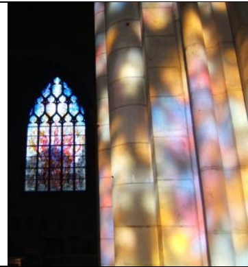
Collégiale Notre Dame à Vernon, vitraux contemporains, 1994