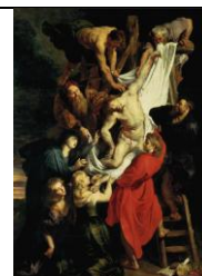
Pierre-Paul RUBENS, La Descente de Croix , 1612-1614, huile sur toile, 420,5 × 320 cm. Cathédrale Notre-Dame, Anvers.