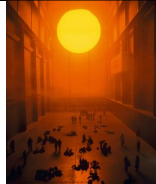
Olafur ELIASSON, The Weather Project , 2003, installation. Tate Modern, Londres.