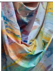
Sam GILLIAM, Carousel (détail), 1970, acrylique et poudre d'aluminium sur toile • 304,8 × 2042 cm