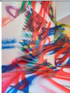
Katharina GROSSE, Splinter (détail), 2022, acrylique sur contreplaqué, mur et sol • 1 750 x 1 000 x 2 200 cm

Extrait de La couleur dans tous ses éclats à la fondation Vuitton, Sophie Flouquet, Judicaël Lavrador, Beaux-Arts Magazine, 25-05- 22