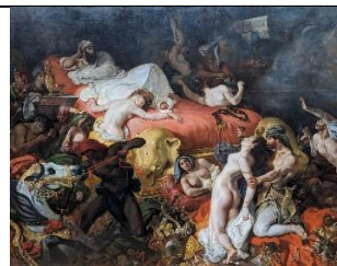
Eugène DELACROIX, La mort de Sardanapale , 1827, huile sur toile, 392 x 496 cm. Musée du Louvre, Paris.