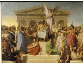
Jean-Auguste-Dominique INGRES, L'Apothéose d'Homère , 1827, huile sur toile, 386 x 512 cm. Musée du Louvre, Paris.