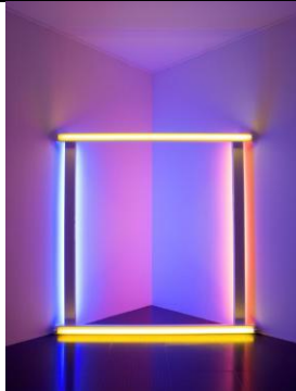
Dan FLAVIN, Untitled (to Donna) 5a , 1971, installation, tubes fluorescents, 144 x 144 x 139 cm. MNAM, Centre Pompidou, Paris.